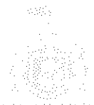
Diagram of a plant stem showing internal structures.

The diagram illustrates the internal structure of a plant stem. The central part is the pith, surrounded by the vascular cambium. The vascular bundles are arranged in a ring, each containing xylem on the inner side and phloem on the outer side. The outermost layer is the cortex, which is covered by the epidermis.