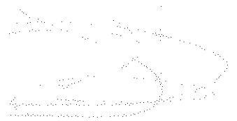
Diagram of a plant stem showing internal structures.